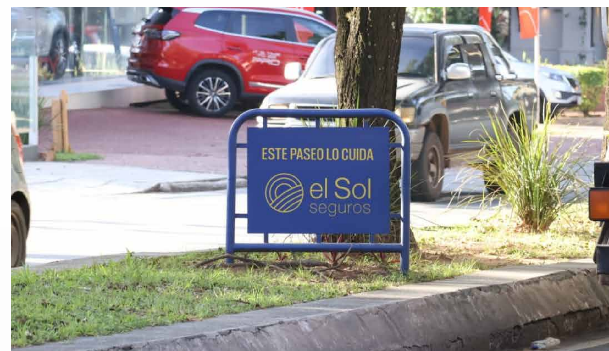
Paseo Central - El Sol Seguros

Cabe destacar que el acuerdo no constituye una exención del pago de los tributos municipales a la empresa que se adhiere como padrino.