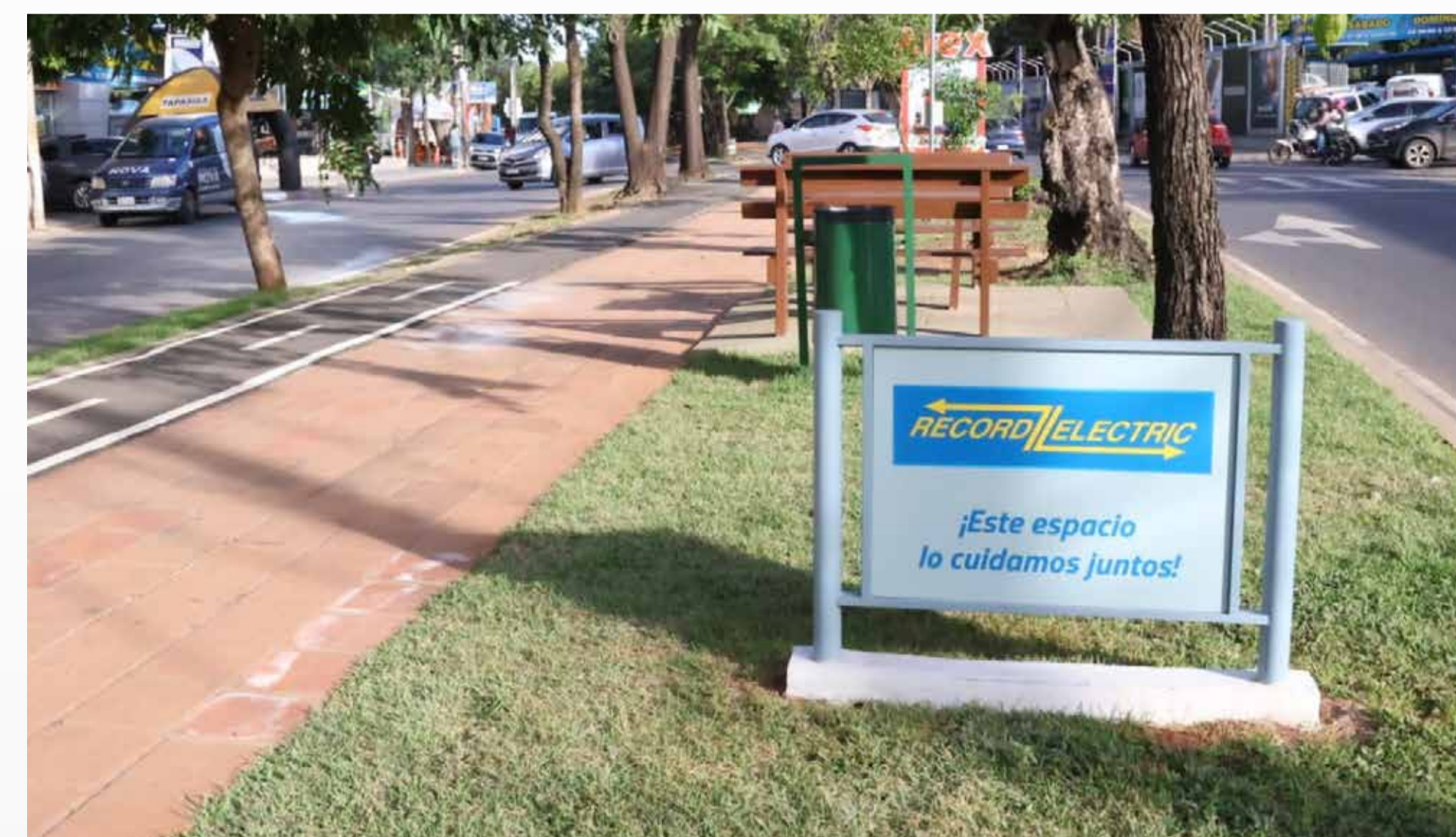
Ciclovía Boggiani - RECORD ELECTRIC