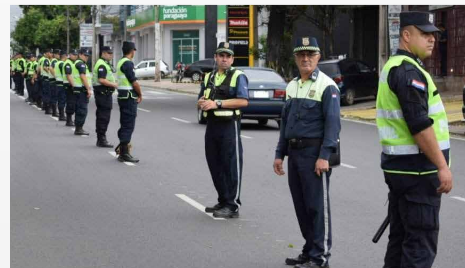
Cobertura en manifestaciones