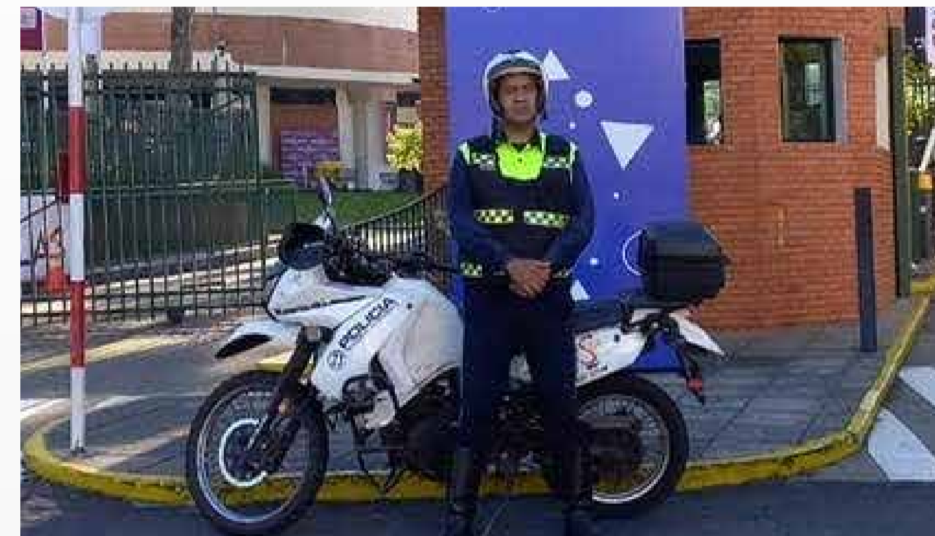
Cobertura en corridas deportivas