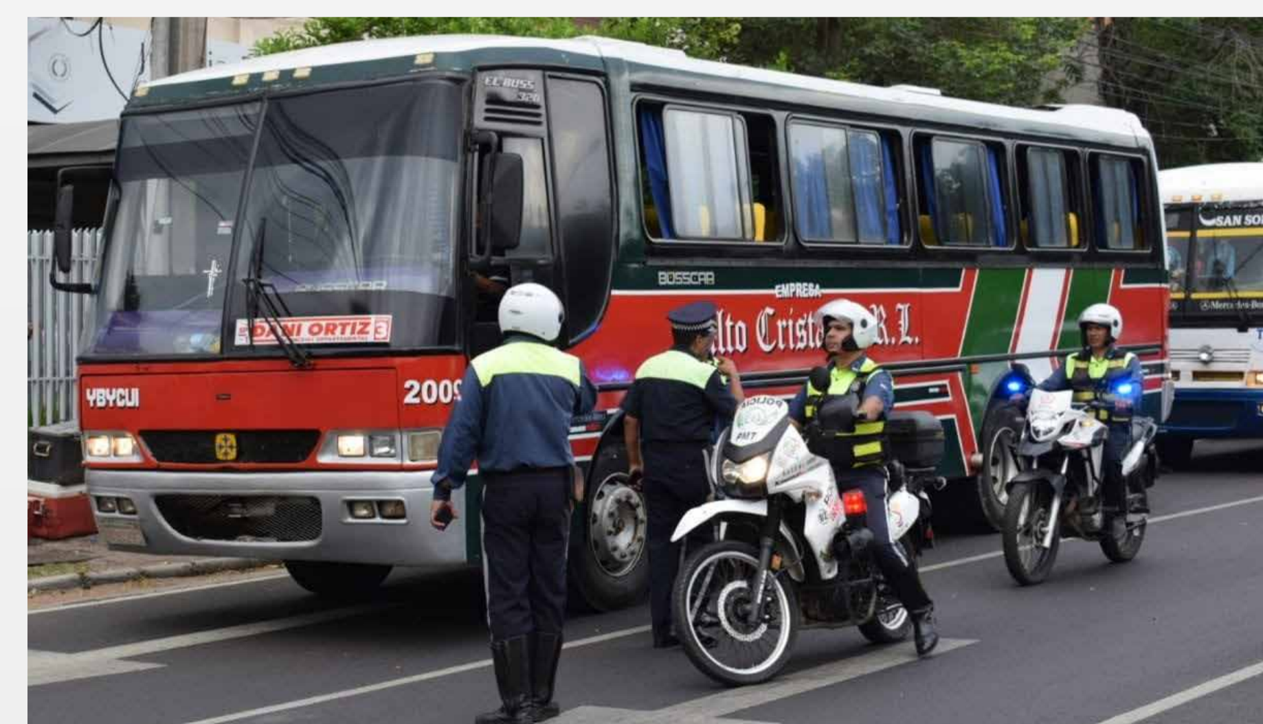
Acompañamiento a caravanas