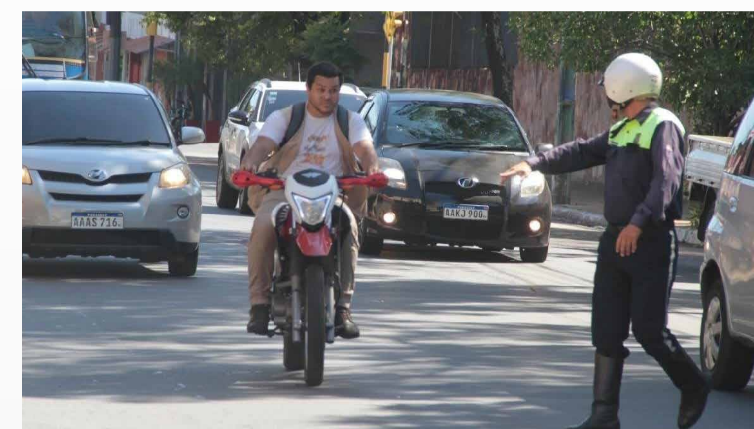
Controles de tránsito

Además, realizamos, por tipo de vehículo, procedimientos con un total de 15.741 infracciones con resultado de notificados y facturados, donde en el primero la cantidad fue de 5.706 y en el segundo 10.035. Igualmente, realizamos, por inmovilización de vehículos, un total de 358 procedimientos, en tanto, por servicio de grúa, un total de 1.384 en el año.