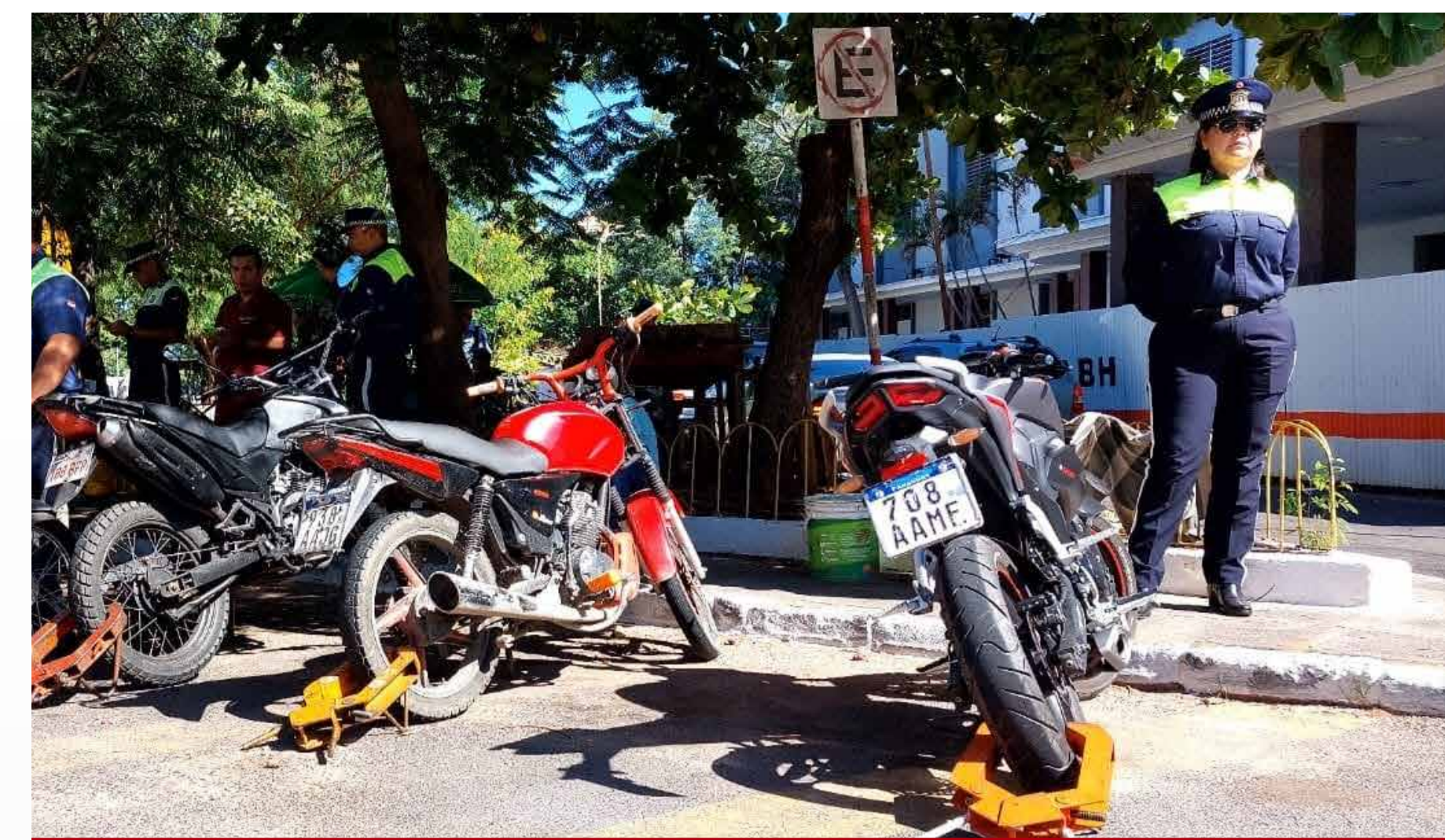
Decomiso de vehículos mal estacionados

Además, trabajamos en la instalación de nuevos semáforos, a través del convenio con la KOICA, donde en el 2023 se instalaron 72 cruces semaforicos, en total 149 cruces con conexión a ATMS, de los cuales hoy están encendidos 138 y quedan 12 por encender.