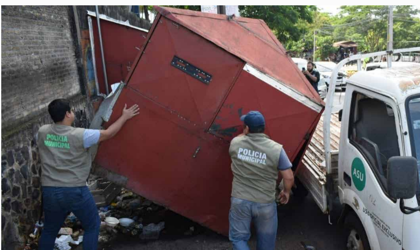
Intervenciones a comercios

Combatimos los criaderos de mosquitos en los barrios con 2045 intervenciones realizadas en patios baldíos, casas habitadas y deshabitadas en estado de abandono, vertederos clandestinos, limpieza y desagote de piscinas, en el marco de la lucha contra el dengue, zika y chikungunya.