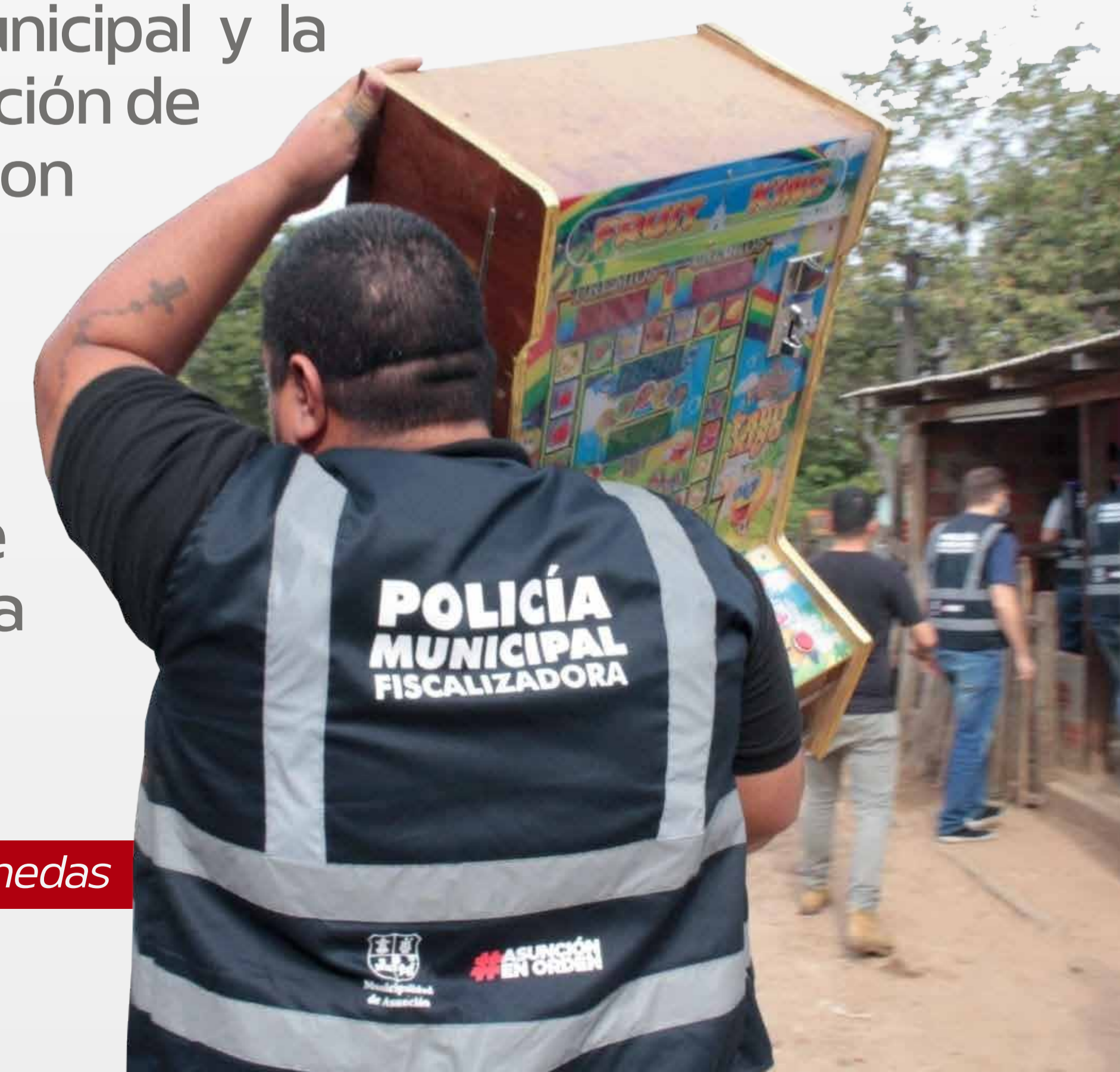
Decomiso de aparatos de tragamonedas

Desde la Dirección de la Policía Municipal Instructora, realizamos actividades que promueven la mejora del sistema de seguridad interna municipal y de los recintos resguardados por personal de seguridad municipal, implementando y aplicando políticas de seguridad. Así