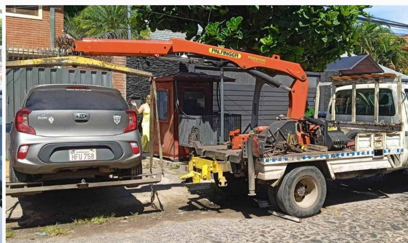
Decomiso de vehiculos mal estacionados