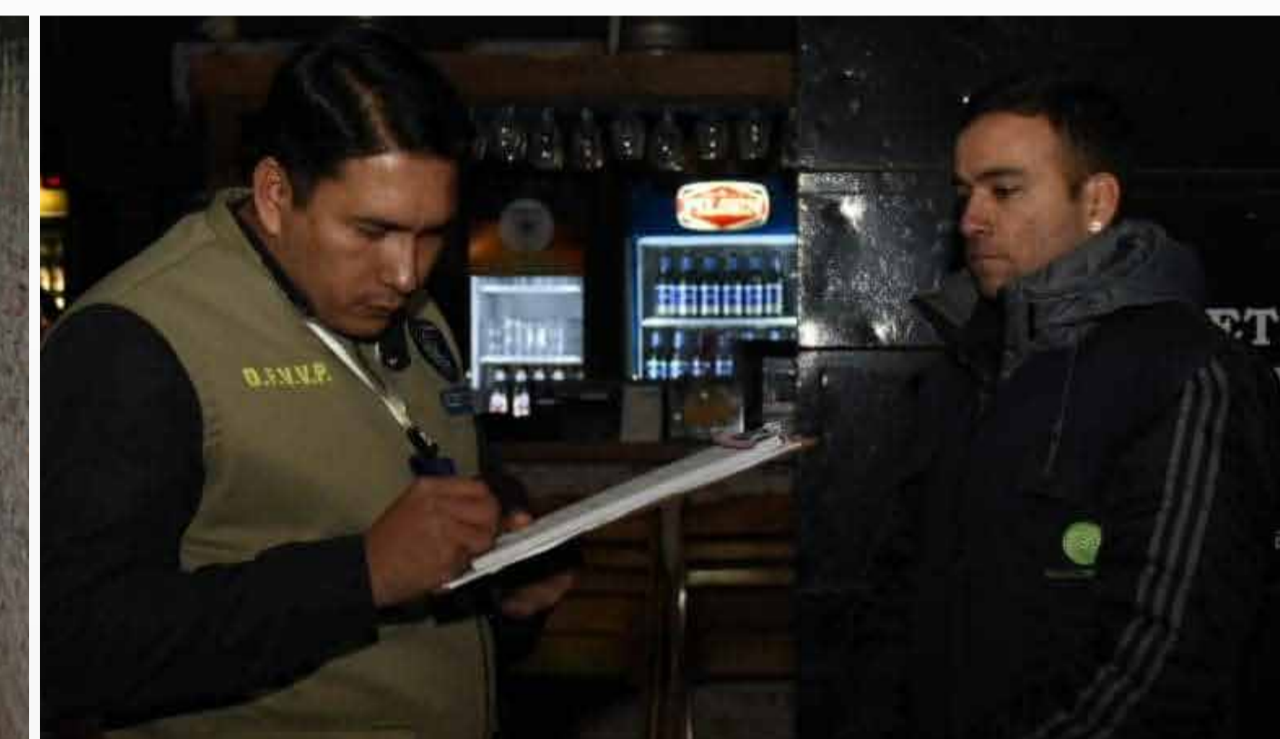
Controles por polución sonora