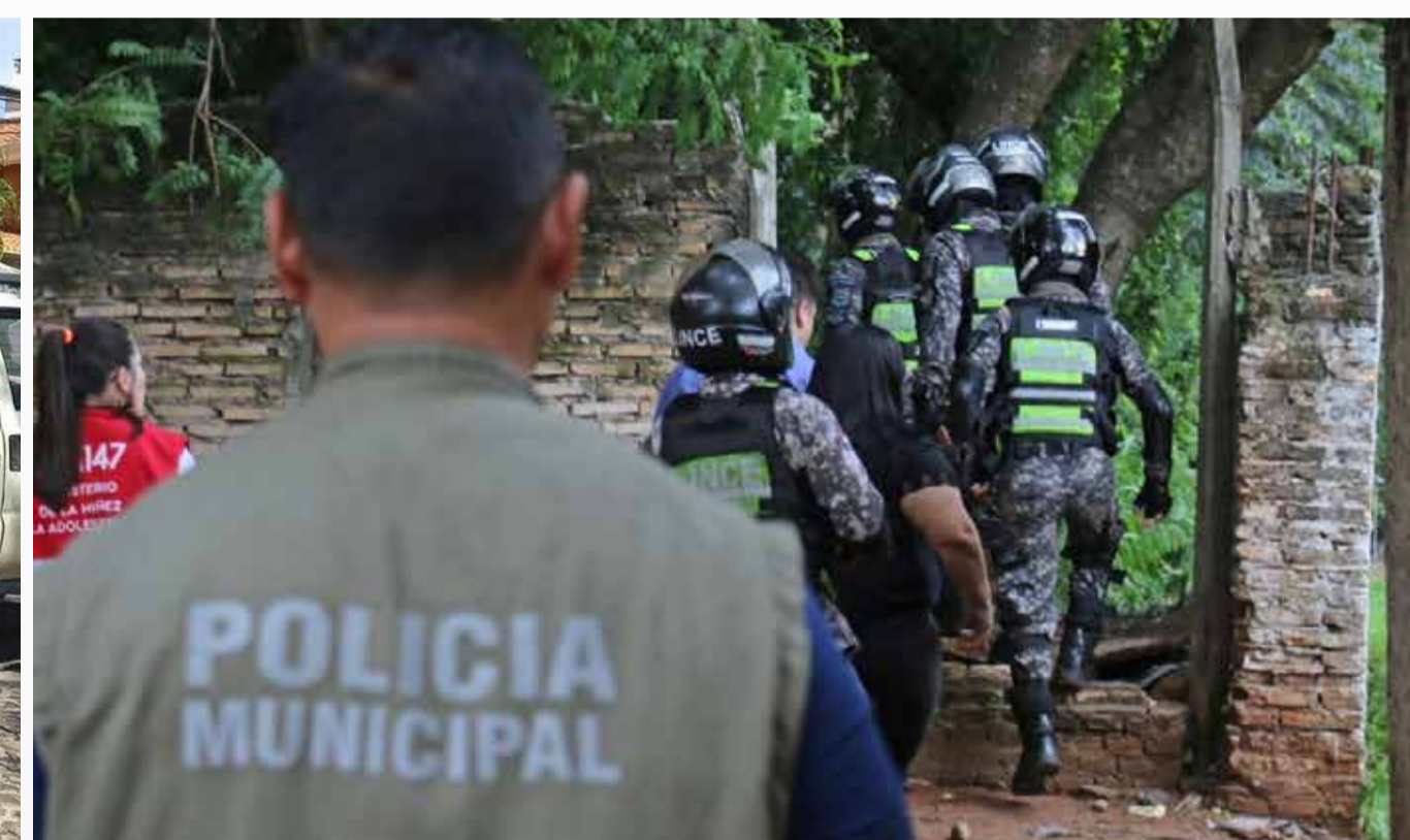
Recuperación de espacios públicos